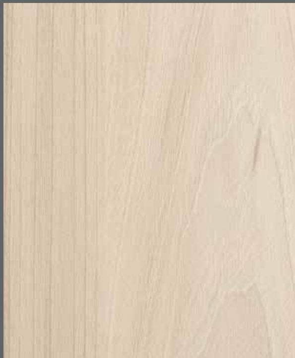
Soft Woodgrain | 9901 LRV 52