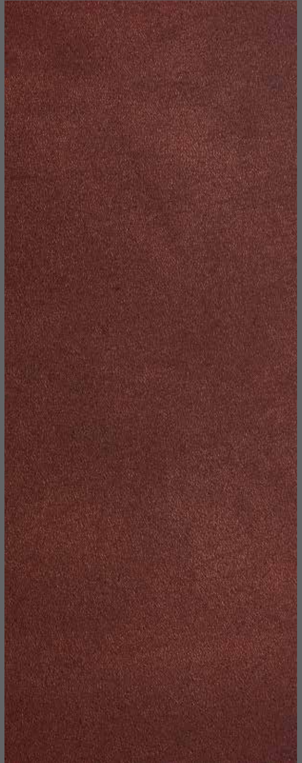
Antique Copper | 9912 LRV 9

Coordinating and contrasting trims available. Farblich passende und kontrastierende Profile verfügbar. Molduras en tonos que contrastan o combinan. Profils de coordination et de contraste disponibles.