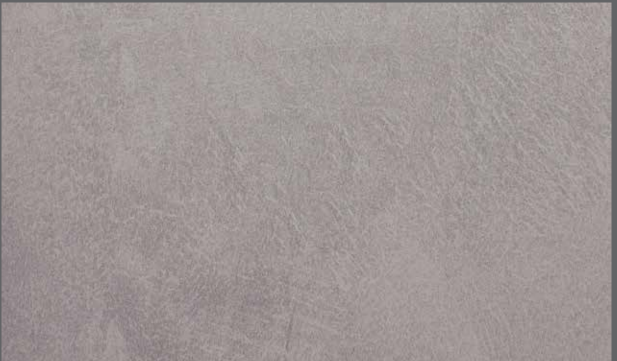
Urban Mineral | 9907 LRV 28

Exact material match with samples cannot be guaranteed. Eine exakte Übereinstimmung des Materials mit Mustern kann nicht garantiert werden. Las muestras no pueden garantizar un color exacto. Les échantillons ne peuvent garantir le coloris exact.