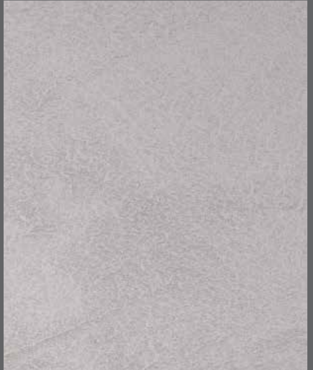
Cool Mineral | 9906 LRV 48