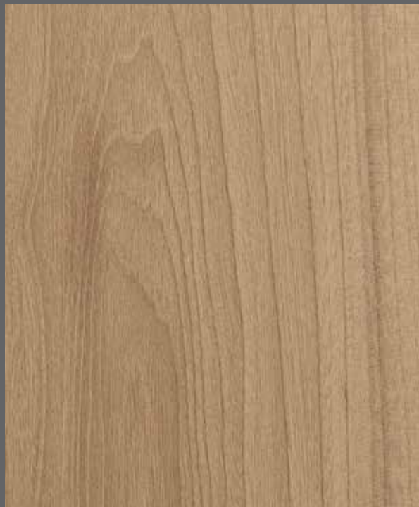
Warm Woodgrain | 9904 LRV 38