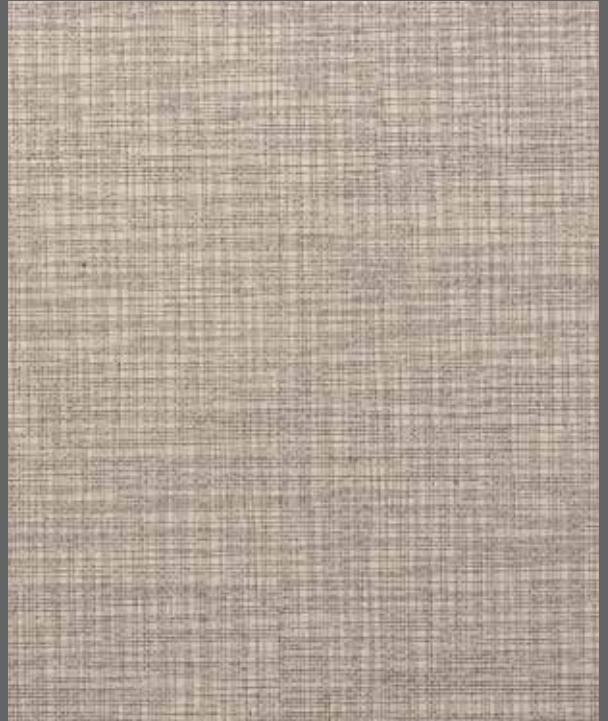
Autumn Weave | 9910 LRV 43