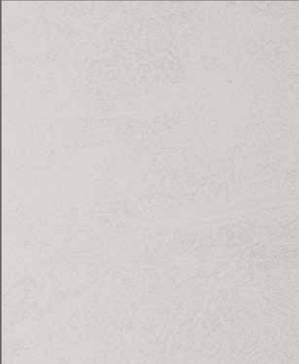
White Mineral | 9905 LRV 61