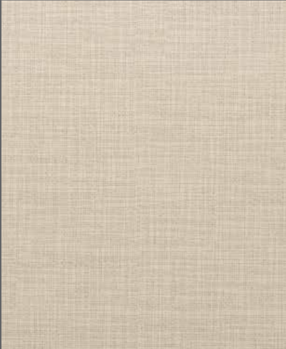
Winter Weave | 9909 LRV 58