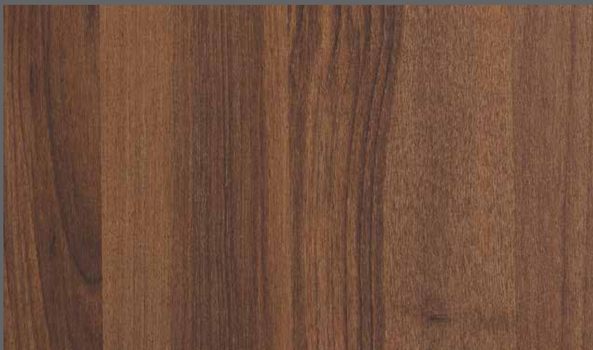
Rich Woodgrain | 9902 LRV 14