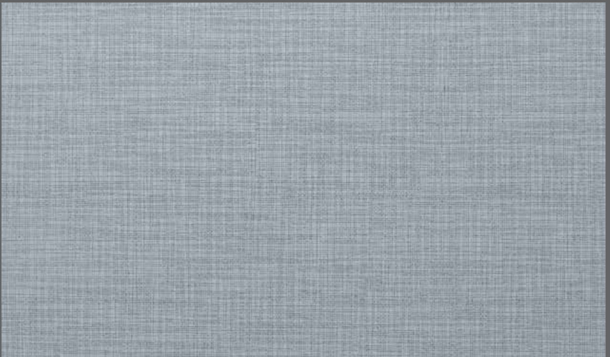
Summer Weave | 9908 LRV 36

LRV = light reflectance value LRV = Lichtreflexionsgrad LRV = Valor de reflectancia de la Luz LRV = IRL : Indice de Réflexion Lumineuse